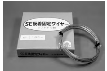
SE 仮着固定ワイヤー(ソフト半円線) ¥1,800