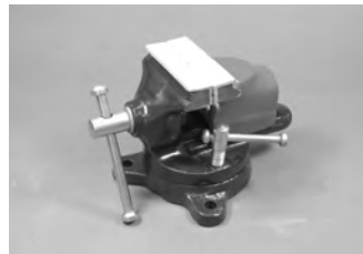
SE-III 固定ホルダー ¥4,200