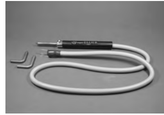
SE-III 単電極 ¥10,800