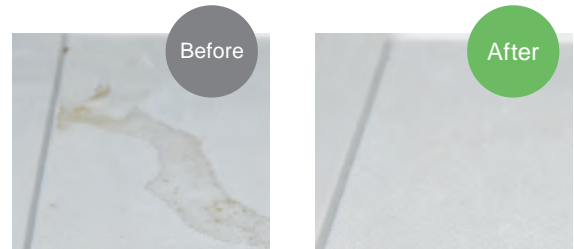
黄ばみ、油汚れにもお使いいただけます